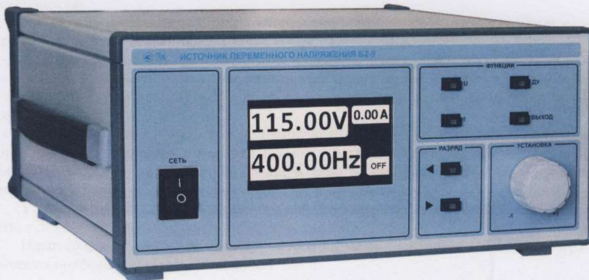
Рисунок 1 - Общий вид прибора

Общий вид прибора приведен на рисунке 1.